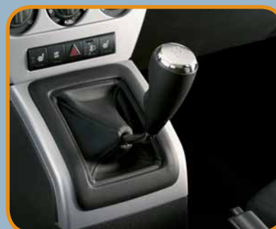
Jeep® Compass Sport con motore 2.4 dual VVT monta di serie una trasmissione manuale a 5 rapporti.