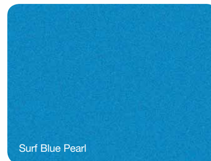
Surf Blue Pearl