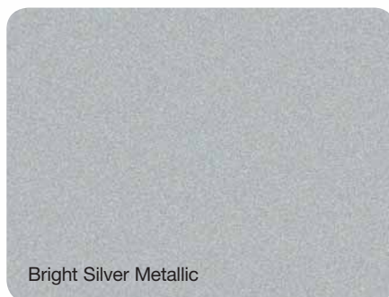
Bright Silver Metallic