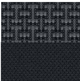
Tessuto Yes Essentials® in Dark Slate Gray ◇ Di serie