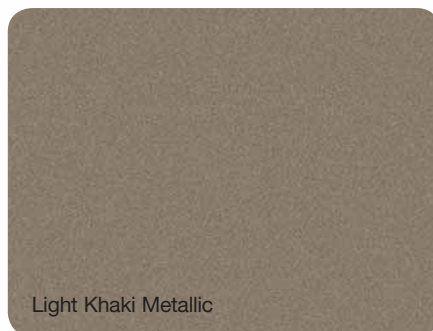
Light Khaki Metallic