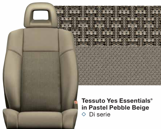
Tessuto Yes Essentials® in Pastel Pebble Beige ◇ Di serie