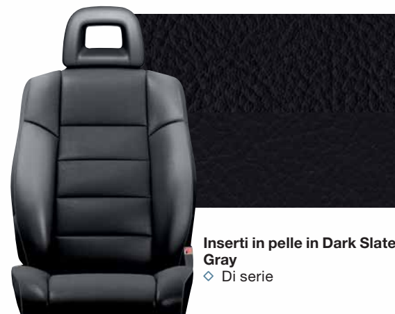
Inserti in pelle in Dark Slate Gray ◇ Di serie