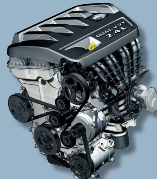
Motore benzina "World Engine" 2.4 dual VVT con sistema di distribuzione a doppia fasatura variabile.

La guidabilità e la stabilità di Jeep® Compass sono costantemente monitorate dall'ESP a 3 modalità (3 mode), dal controllo della trazione (TCS) e dal sistema di frenata antibloccaggio (ABS) sulle quattro ruote con assistenza alla frenata d'emergenza (BAS). Jeep® Compass, la nuova interpretazione di uno stato mentale libero, la scoperta di nuovi orizzonti.