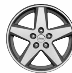
Cerchi in lega di alluminio 18"x 7.0" ◇ Di serie ◇ Optional sulla versione Sport