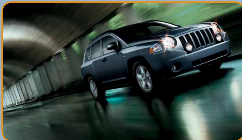
JEEP. COMPASS SPORT IN STEEL BLUE METALLIC