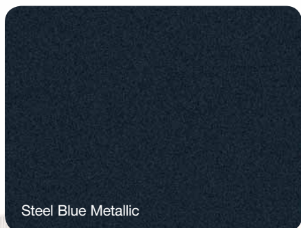
Steel Blue Metallic