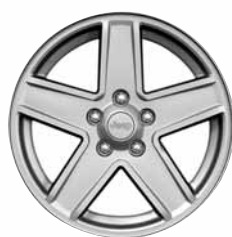
Cerchi in lega di alluminio 17"x 6.5" ◇ Di serie