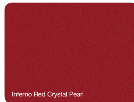
Inferno Red Crystal Pearl