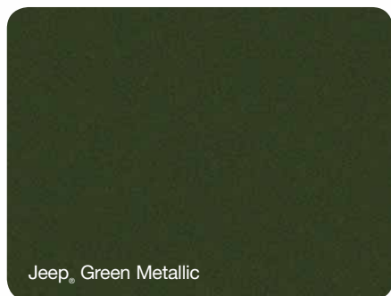
Jeep® Green Metallic