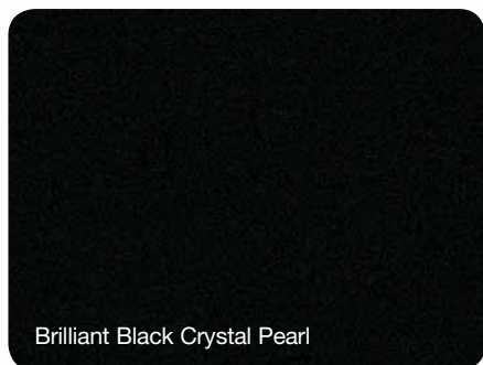
Brilliant Black Crystal Pearl