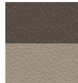
Inserti in pelle in Dark Pebble Beige/Pastel Pebble Beige ◇ Di serie