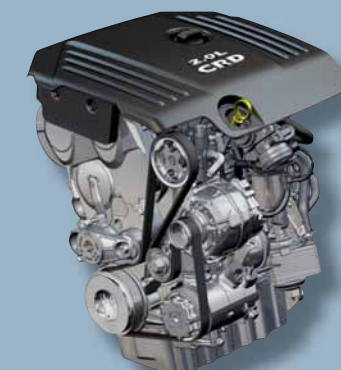
Motore 2.0 L4 16V DOHC turbodiesel a controllo elettronico con testata in alluminio e sistema di iniezione diretta "High Pressure".